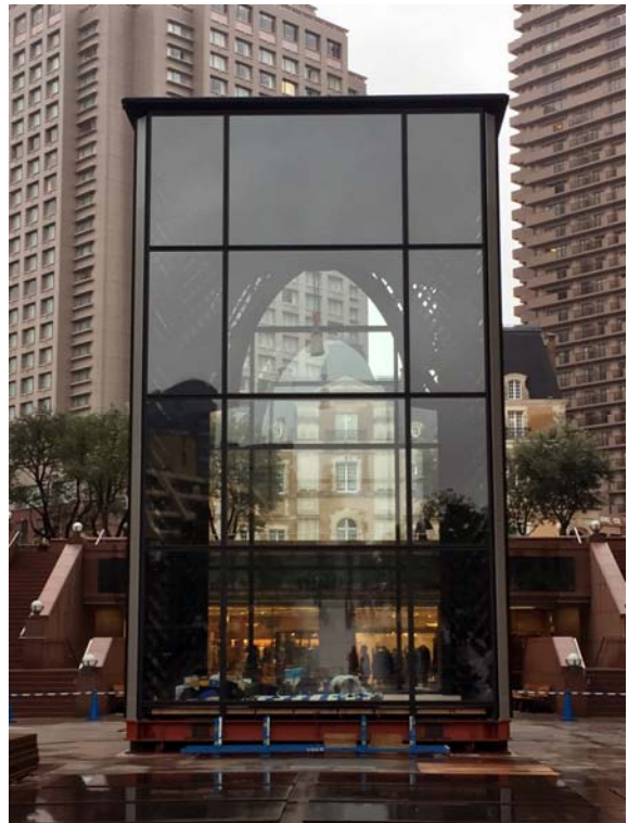
アルミ製ショーケース

外装デザインとしても美しい構造材「ラチスパネル」を採用することで、従来にない清廉な空間を実現したアルミ製ショーケースは、時代を超えた永遠の価値を表現するバカラ シャンデリアを、まるで宝石箱のように、より美しく引き立たせます。