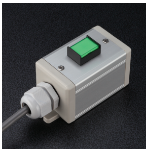
45 × 45 (D) 表示灯 1 点