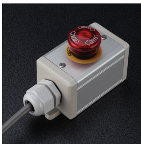
45 × 45 (D) 非常停止スイッチ 1 点 (Φ 25・Φ 30)